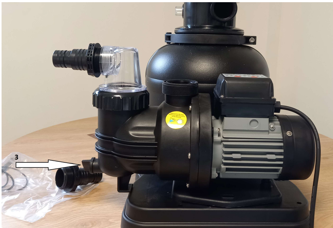
Emplacement du bouchon de vidange de la pompe (3)