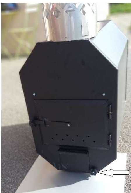
Bouchon de vidange

Vous devez vider le bain complètement et purger la chaudière en dévissant légèrement le bouchon* puis en tirant le bouchon de purge de la chaudière :